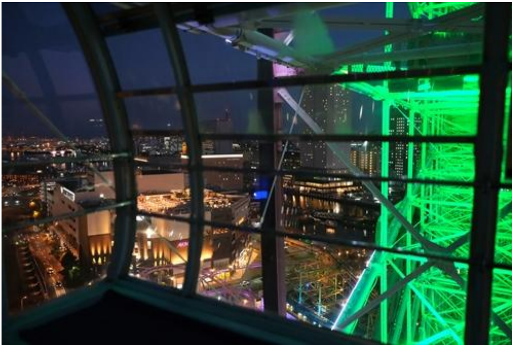
港が煌めく横浜ベイブリッジビュー。